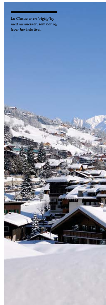
La Clusaz er en "rigtig" by med mennesker, som bor og lever her hele året.

Den kendte ost Reblochon er "opfundet" i området. Flere delikatesseforretninger tilbyder lokale specialiteter.